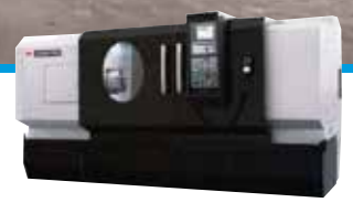
TORNOS PARALELOS TORNOS CNC CENTROS DE MECANIZADO