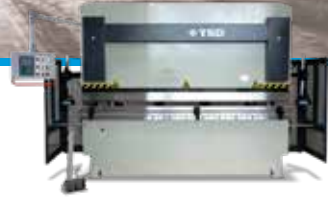
PLEGADORAS HIDRÁULICAS CON NC Y CNC