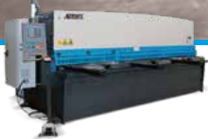
GUILLOTINAS HIDRÁULICAS CON NC Y CNC