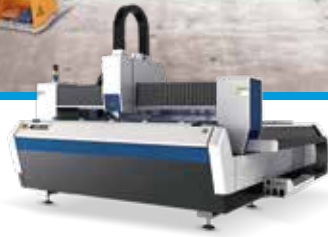
MÁQUINAS DE CORTE LÁSER MÁQUINAS DE CORTE PLASMA